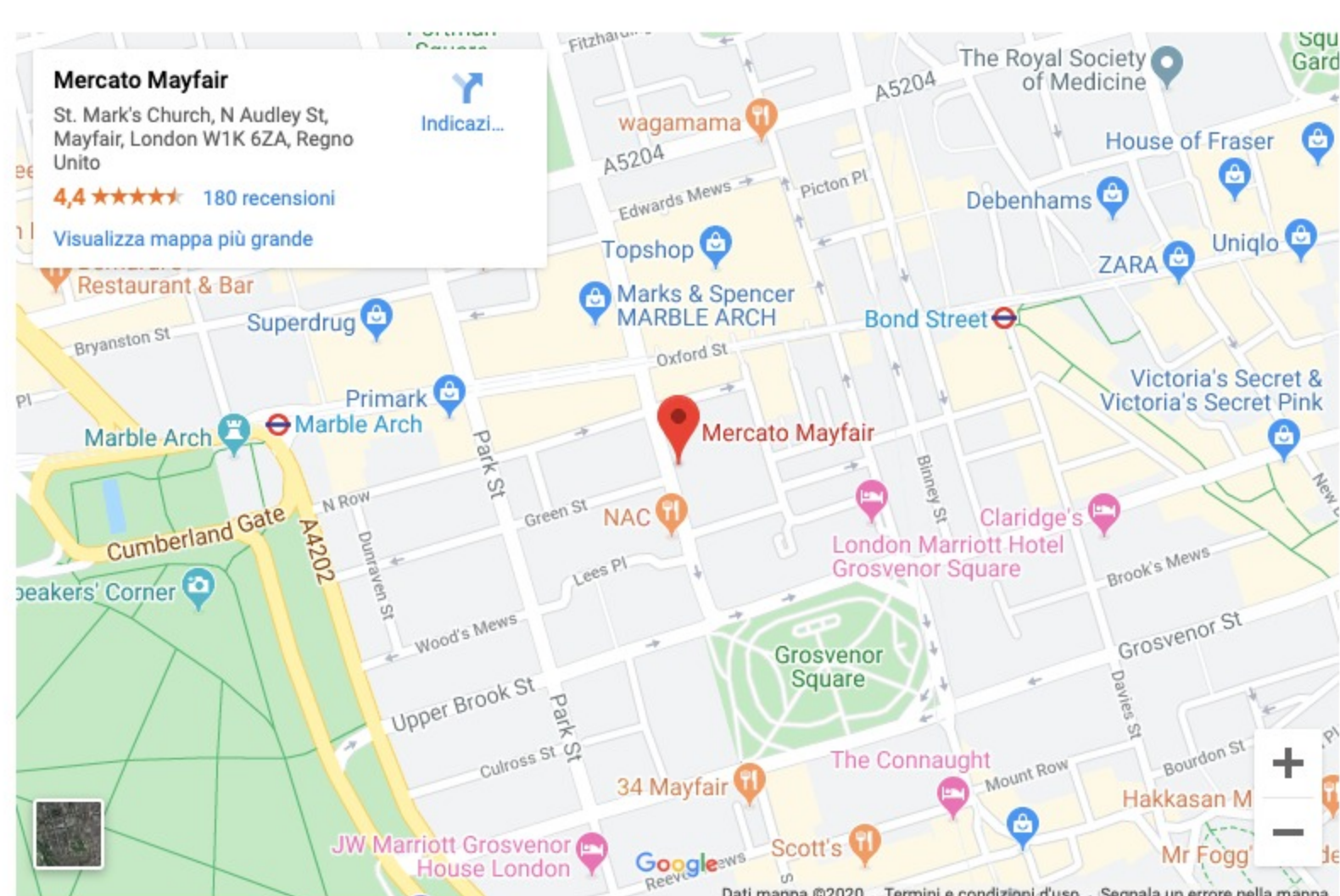
Fresco Mercato Mayfair, St. Mark's Church, N Audley St, Mayfair, London W1K 6ZA, Regno Unito